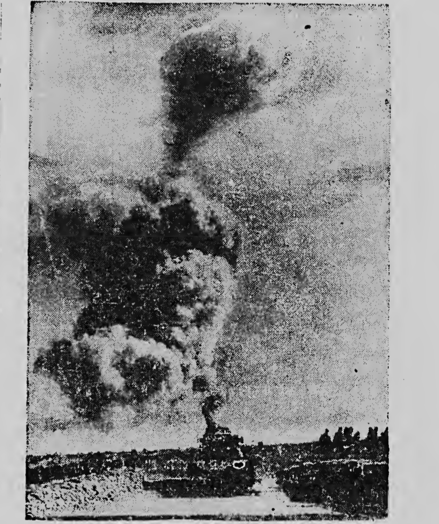
NU AMERIKA herhaaldelijk door wervelstormen geteisterd wordt, vragen opnieuw velen zich af, of de stormen niet mede veroorzaakt worden door de atoombomtoplossingen in de Westzij van Nevada. Hierboven een foto van de laatste proef van dit voorjaar, het afschieten van een atoomgranaat. De ontloffing kwam nog tien seconden na het afschieten, op een afstand van negen mijl van het kanon. Atomic Annie, zoals het kanon genoemd wordt, is een baby van 85 ton, met een caliber van 280 mm. De ontloffing stond in kracht gelijk met die van een springlading van 15.000 ton TNT.

GEEN CLEMENTIE VOOR ROSENBERGS NEW YORK. - De Amerikaanse rechter Kaufman heeft het jongste beroep van de Rosenbergs verworpen. ISRAELIJSCH-JORDAANS OVERLEG TEL AVIV. - De leiders van de Israëlsche en Jordaanse delegaties in de gezamenlijke bestuurscommissie hebben te Jeruzalem in tegenwoordigheid van generaal Riley, vertegenwoordiger van de Verenigde Naties, een overeenkomst getekend ter bestrijding van de infiltraties in het grensgebied tussen Israël en Jordanië. Dit is bekend gemaakt door een militaire woordvoerder van Israël te Tel Aviv.